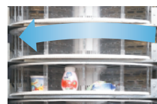
Sportelli chiusura apertura automatici