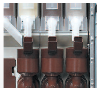
Mixer Fas ad alta resa con sistema auto aspirante