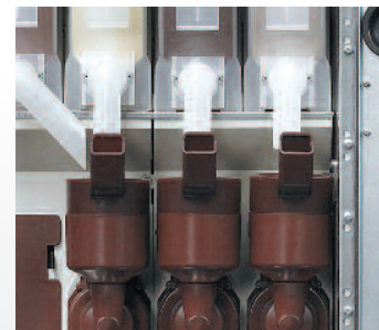
Mezclador FAS con sistema de autoaspiración.