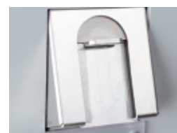
Validador de monedas antivandálico