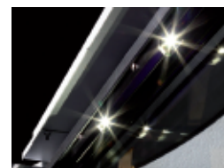
Iluminación interna con power leds laterales y superiores