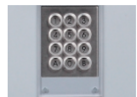
Teclado iluminado protegido con Lexan 5 mm